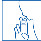
رسم توضيحي ٤