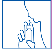
رسم توضيحي ٣