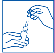
رسم توضيحي ١